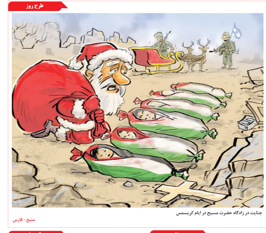
جنایت در زادگاه حضرت مسیح در ایام کریسمس

تکرار ادرار: زمانی که سطح قندخون بالا می‌رود، کلیه‌ها با تصفیه خون، قند اضافی را از بدن خارج می‌سازند. این امر موجب تکرار ادرار، به‌ویژه در شب می‌شود. افزایش تشنگی: تکرار ادرار که برای خروج کردن قند اضافی خون ضروری است، باعث می‌شود بدن آب بیشتری از دست بدهد. این امر به مرور زمان باعث کم‌آبی بدن و تشنگی بیش از حد معمول می‌شود. احساس گرسنگی مداوم: از علائم دیابت نوع دو به شمار می‌رود. افراد مبتلا به دیابت، از غذایی که می‌خورند به اندازه کافی انرژی دریافت نمی‌کنند. ورود غذا به معده، باعث تأمین انرژی نمی‌شود، جذب گلوکز غذا توسط سلول‌های است که انرژی مورد نیاز را به بدن می‌رساند. سیستم گوارشی غذا را به گلوکز (منبع تأمین انرژی) تجزیه می‌کند، اما در مبتلایان به دیابت، گلوکز به اندازه کافی از جریان خون به سلول‌های بدن وارد نمی‌شود.