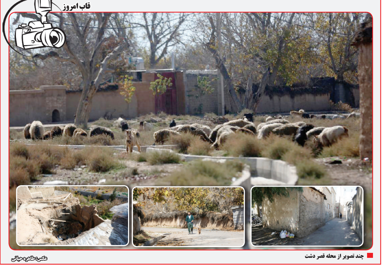
چند تصویر از محله قصر دشت