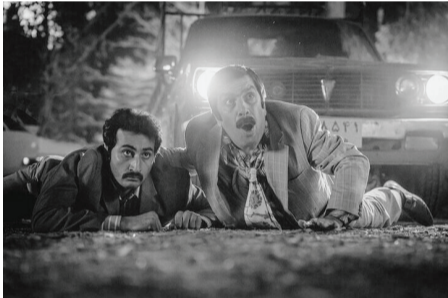
فیلم‌نامه آن توسط رضا کشاورزحداد به نگارش درآمد ه است. رضا کشاورزحداد که نخستین تجربه کارگردانی سینمایی خود را پشت سر می‌گذارد، پیش از این چندین فیلم کوتاه ساخته که در جشنواره‌های مختلف هم حضور داشته است.

باشگاه فیلم سوره و کانون پرورش فکری کودکان و نوجوانان تولید می‌شود و باشگاه فیلم سوره و کانون پرورش فکری کودکان و نوجوانان تولید می‌شود و